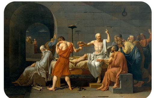
Jacques-Louis DAVID, La mort de Socrate , 1787