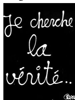
◀ BEN (Benjamin VAUTIER), Je cherche la vérité , 2001