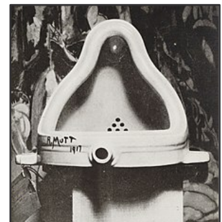
DUCHAMP Marcel, Fountain , 1917